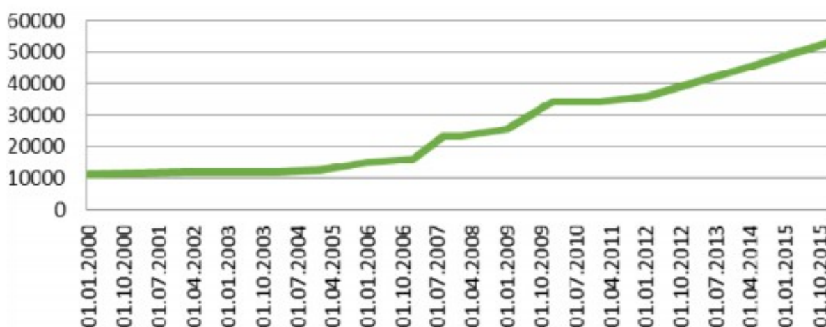
График 1. Максимальный размер пособия по беременности и родам за 2000–2015 гг.

В основном это связано с тем, что новорожденные требуют большое количество затрат на памперсы, пеленки, распашонки, детское питание и т.д. После 1,5 лет родители тратят меньше денег, так как детское питание можно комбинировать с тем что едят взрослые, и уже можно обойтись без использования памперсов.